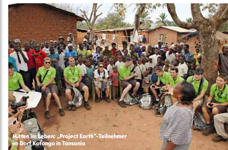
Mitten im Leben: „Project Earth“-Teilnehmer im Dorf Katongo in Tansania

„Überraschend“, „unkonventionell“, „innovativ“, so das Medienecho auf „Project Earth“. Die Umweltschutz-Initiative von Opel hat auf bedrohte Ökosysteme aufmerksam gemacht. Dabei bereiten 13 ausgewählte Teilnehmer Tansania, die Arktis, den Golf von Kalifornien und den Regenwald in Panama. Sie berichten auf Facebook und im Blog – hier eine Auswahl der Eindrücke.