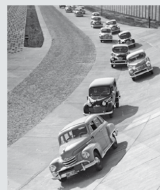
Die Modellpalette '51 fährt im Corso über das neue Prüffeld

TEST EINS, ZWEI, DREI: Opel hat vor 60 Jahren sein erstes vollwertiges Testzentrum in Betrieb genommen. 1951 hieß das Testzentrum noch Prüffeld und lag in unmittelbarer Nachbarschaft des Rüsselsheimer Werksgeländes. Auf 150.000 Quadratmetern konnten Prototypen geschützt vor unerwünschten Blicken erprobt werden. Schnellfahr- und Pflasterstrecke gehörten zur Ausstattung.